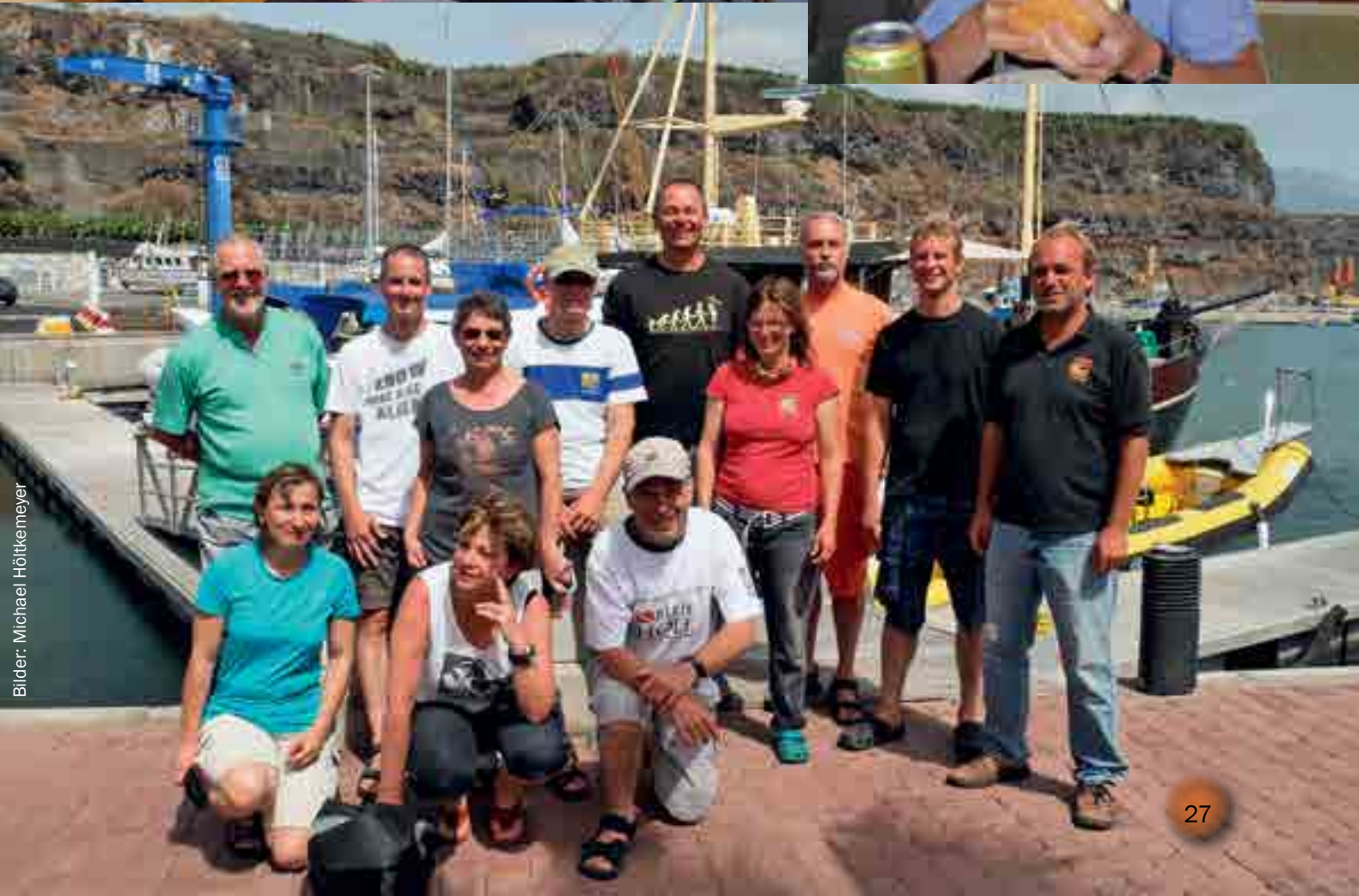
Bilder: Michael Hötkemeyer